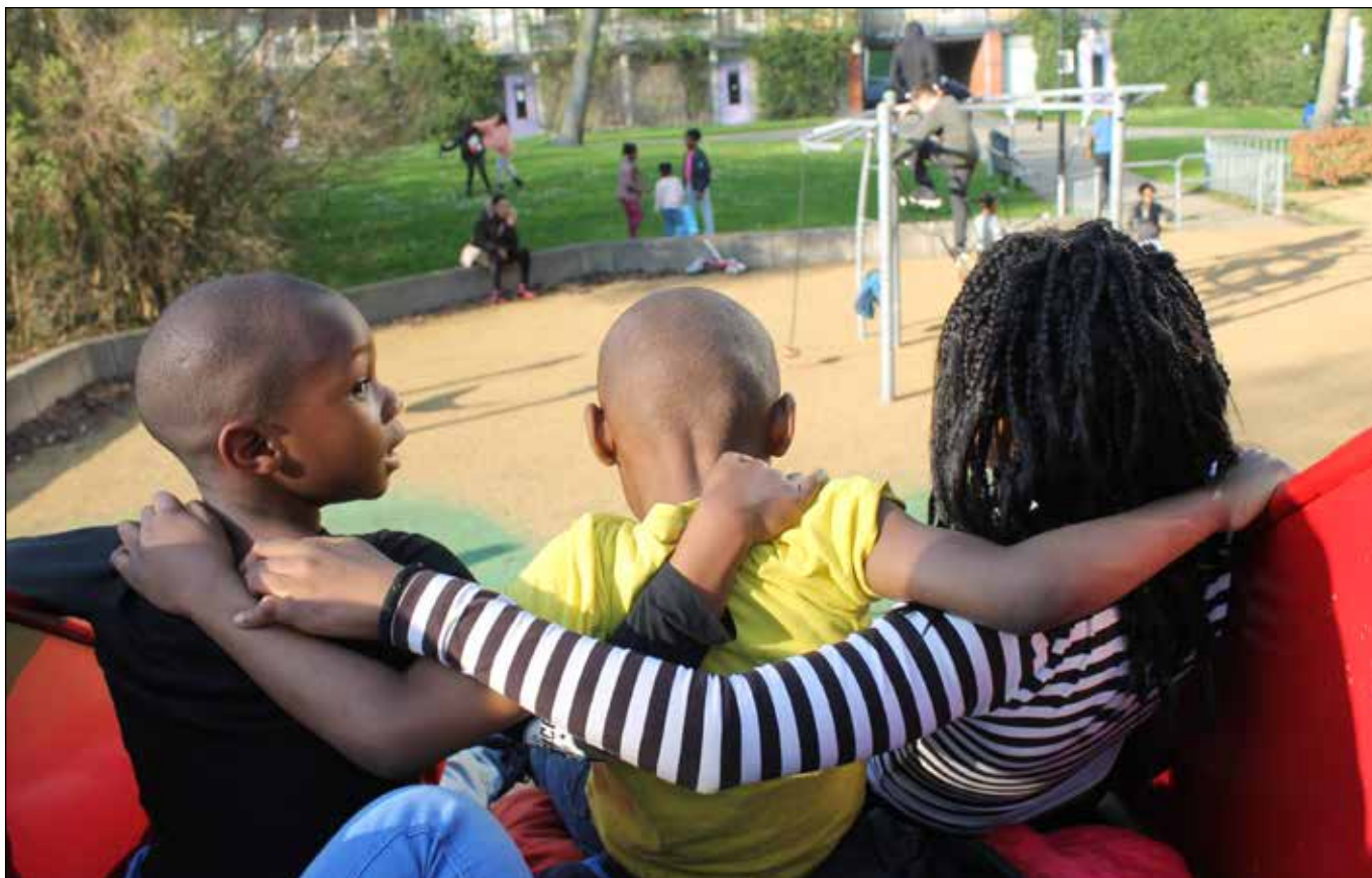
Enkele kinderen uit het Harriet Tubman Huis

een klein gedeelte van de drie flats en is niet veel meer dan een keukentafel en een keukenblokje. De vrouwen die tijdelijk zijn ondergebracht bij