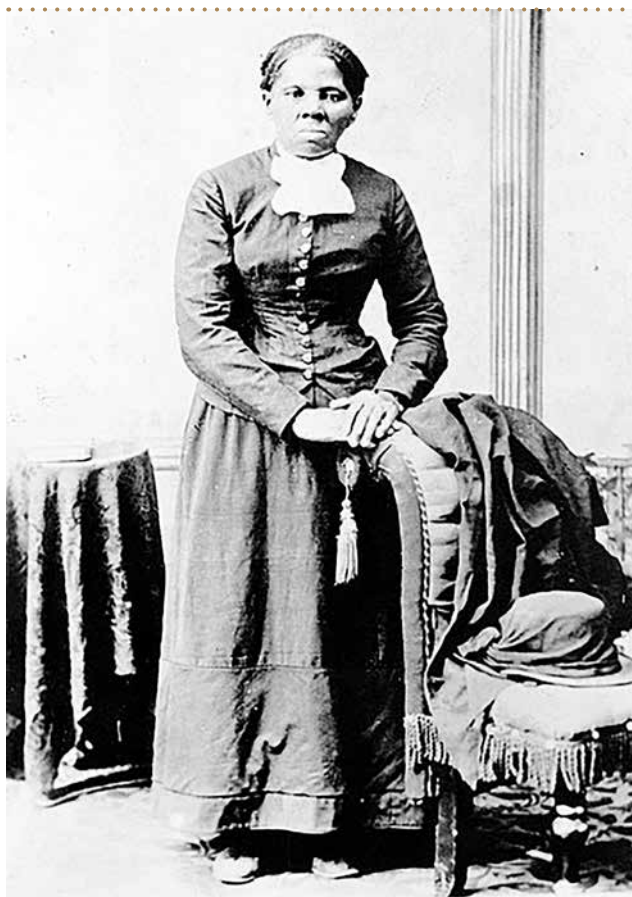
Harriet Tubman (*1823 – †1913)

De vrouwen die in het Harriet Tubman Huis komen wonen hebben vaak al een eigen advocaat die ze ook houden gedurende de tijd dat een aanvraag loopt. De kinderen