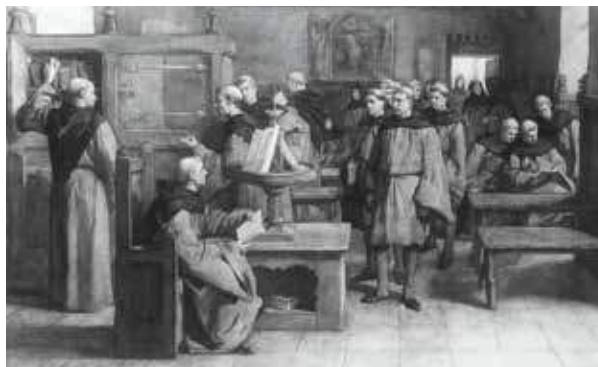
Geromantiseerde weergave van Geert Grote met zijn volgelingen

Inloop vanaf 14.00 uur. Na de pauze gelegenheid tot vragen stellen/discussiëren. Einde bijeenkomst 16.45 uur.