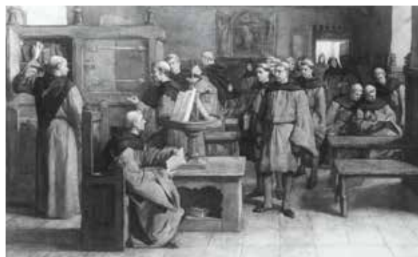
Geromantiseerde weergave van Geert Grote met zijn volgelingen

Inloop vanaf 14.00 uur. Na de pauze gelegenheid tot vragen stellen/discussiëren. Einde bijeenkomst 16.45 uur.