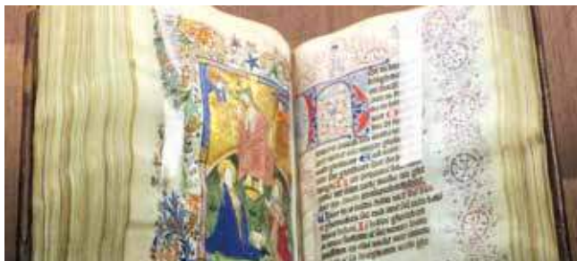
Libro d'ore van Geert Grote

De volgende inleiders nemen u mee op reis door een boeiende geschiedenis die zal eindigen met de conclusie dat het gedachtegoed van de Moderne Devotie meer dan ooit een inspiratiebron kan zijn in de huidige tijd.