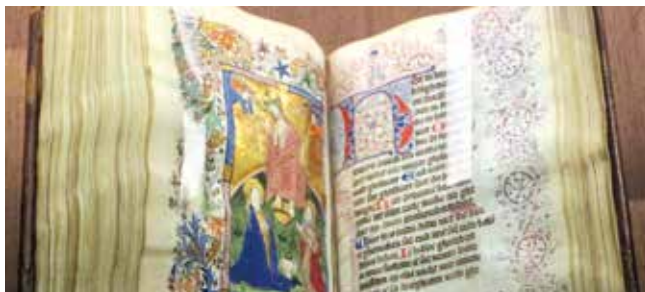
Libro d'ore van Geert Grote

De volgende inleiders nemen u mee op reis door een boeiende geschiedenis die zal eindigen met de conclusie dat het gedachtegoed van de Moderne Devotie meer dan ooit een inspiratiebron kan zijn in de huidige tijd.