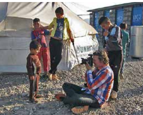
Een fotograaf in het kamp bij Sulaymaniyah in 2016