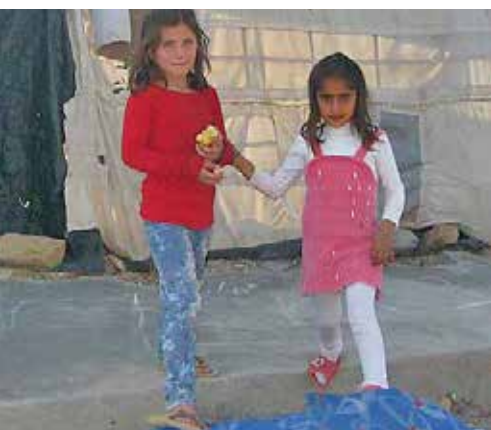
Enkele kinderen in het kamp.

De stad Sulaymaniyah ligt in de autonome regio Koerdisch Irak. Een regio die vanaf de jaren '90 van de vorige eeuw onder toezicht van de VN staat als autonome regio. Een gebied dat ook gespaard bleef van de zware sancties en economische boycot die de westerse wereld Irak oplegde in die jaren '90. In de loop van de geschiedenis heeft Koerdistan altijd veel vluchtelingen opgevangen. Ter illustratie schrijft Yosé: “In 1991 telde Koerdistan drie miljoen inwoners, 2018 waren het er negen miljoen. Alle Koerdische steden zijn omgeven door diverse grote vluchtelingenkampen, nog steeds. Kirkuk, een van de grotere steden, bouwde al een hele grote nieuwe buitenwijk erbij, bijna een stad, waarvoor bisschop Mirkis werd gevraagd een grote school op te richten.”