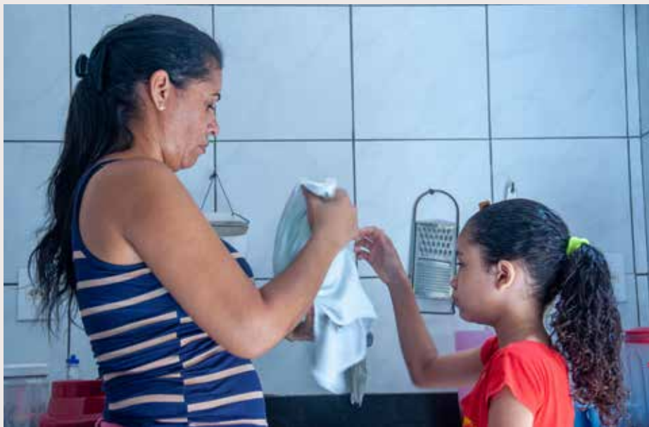
Een van de kinderen met haar sociale moeder