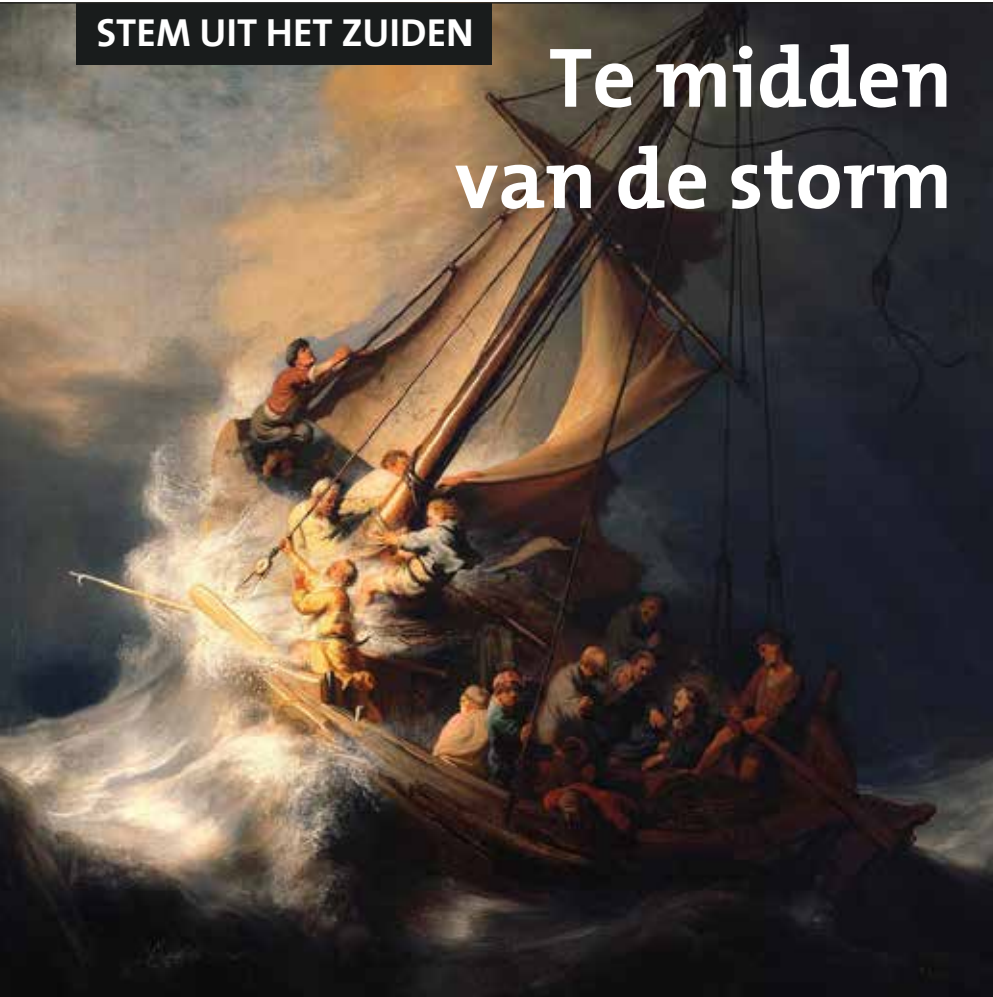
Rembrandt van Rijn: Storm op het meer

“Toen een hevige stormbui op het meer losbarstte, maakte het schip water en ze verkeerden in nood. Ze liepen dan ook naar Hem toe en maakten Hem wakker met de uitroep: ‘Meester, Meester, wij vergaan!’ Hij stond op, richtte zich met een dwingend woord tot de wind en het woeste water; ze bedaarden en het werd stil.”