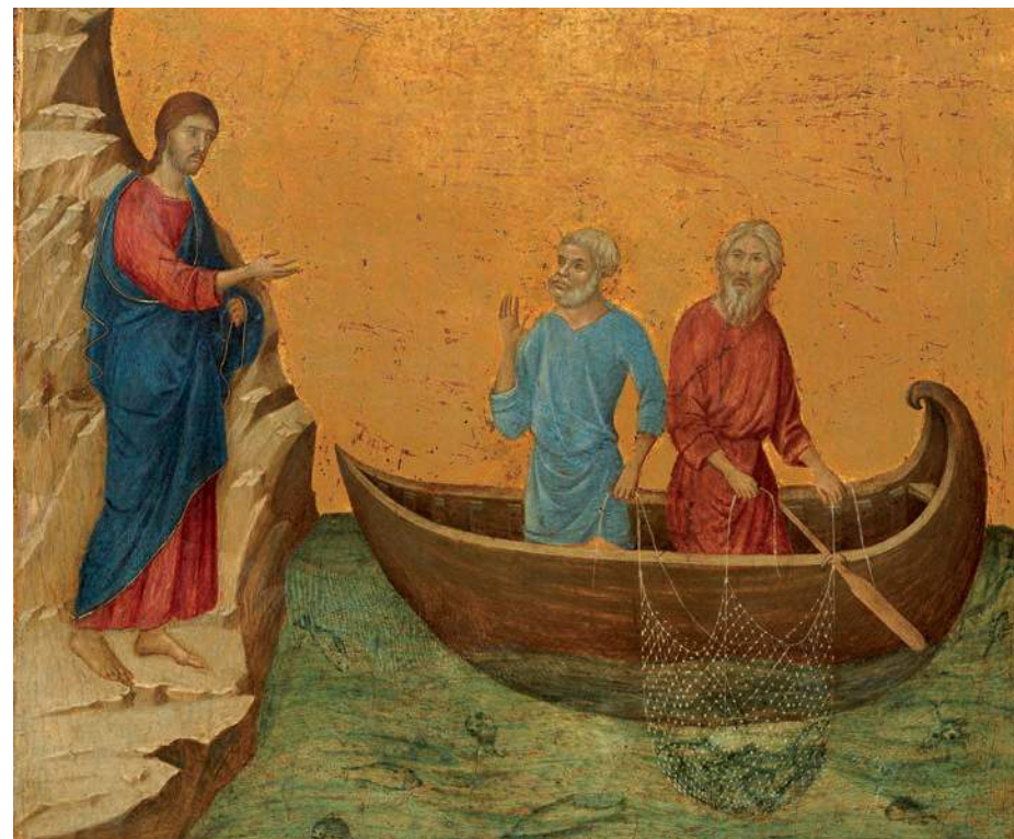
Afbeelding: De roeping van Petrus en Andreas

Wij bidden U om roepingen tot het priesterschap, het diaconaat en het religieuze leven; dat vele mannen en vrouwen uw roepstem mogen horen en in geloof op deze stem mogen antwoorden, tot heil van de wereld en tot lof en eer van uw Naam.