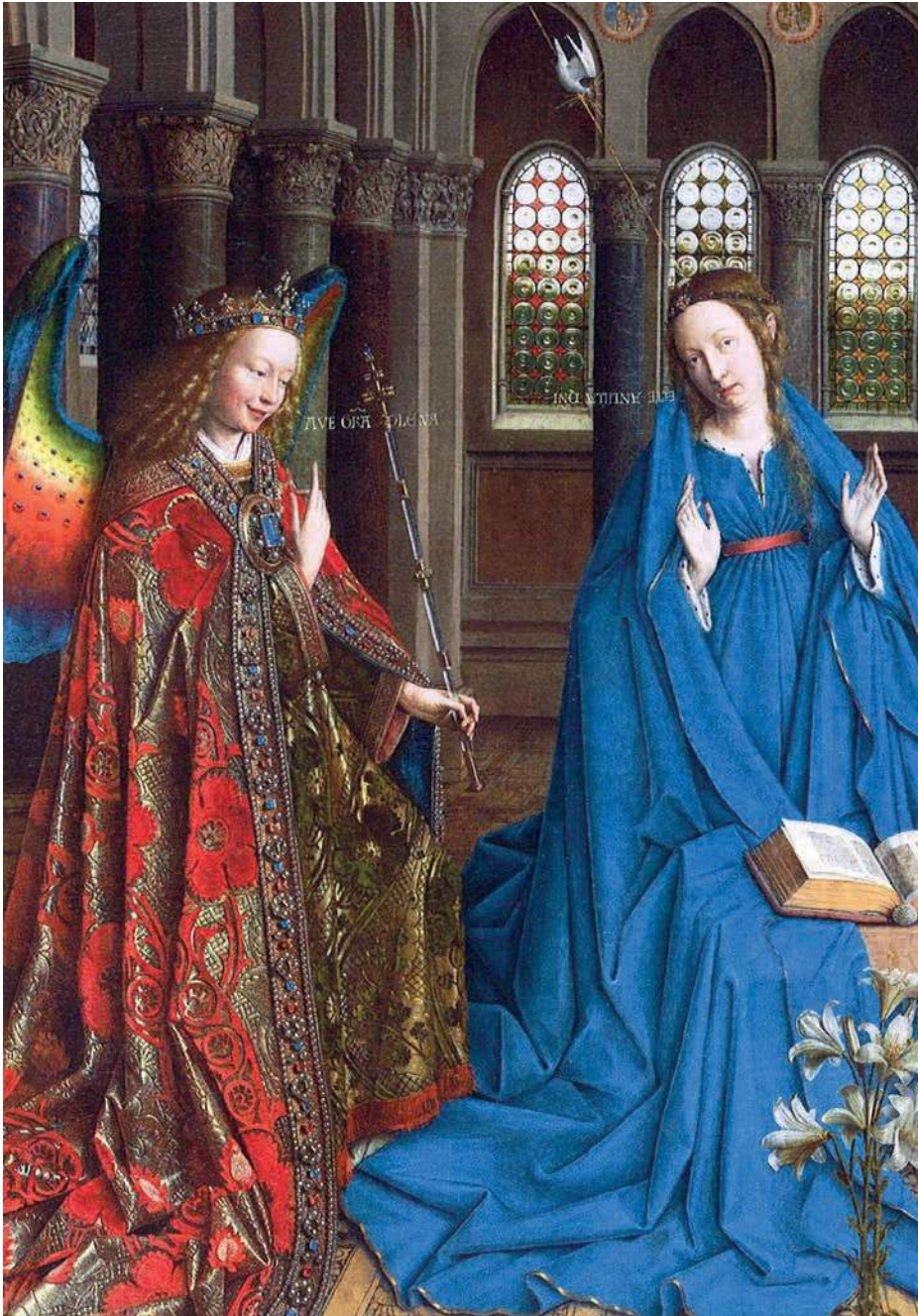
Afbeelding: Jan van Eyck, Annunciatie (detail)