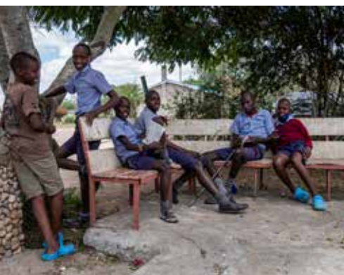
Enkele leerlingen van het centrum