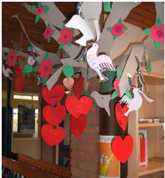
Vredesboom basisschool in Nijkerk.

Op de website www.vredesweek.nl kunt u meer informatie vinden over de Vredesweek en in de webshop zijn materialen te downloaden of te bestellen, om zelf een (corona- proof) viering of activiteit te organiseren.