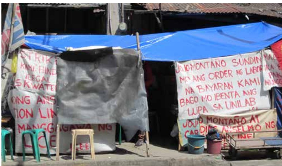
Picket-line van protesterende arbeiders met spandoeken