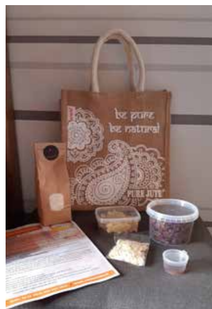
Pure Jute tasje met ingrediënten voor één Paasbrood