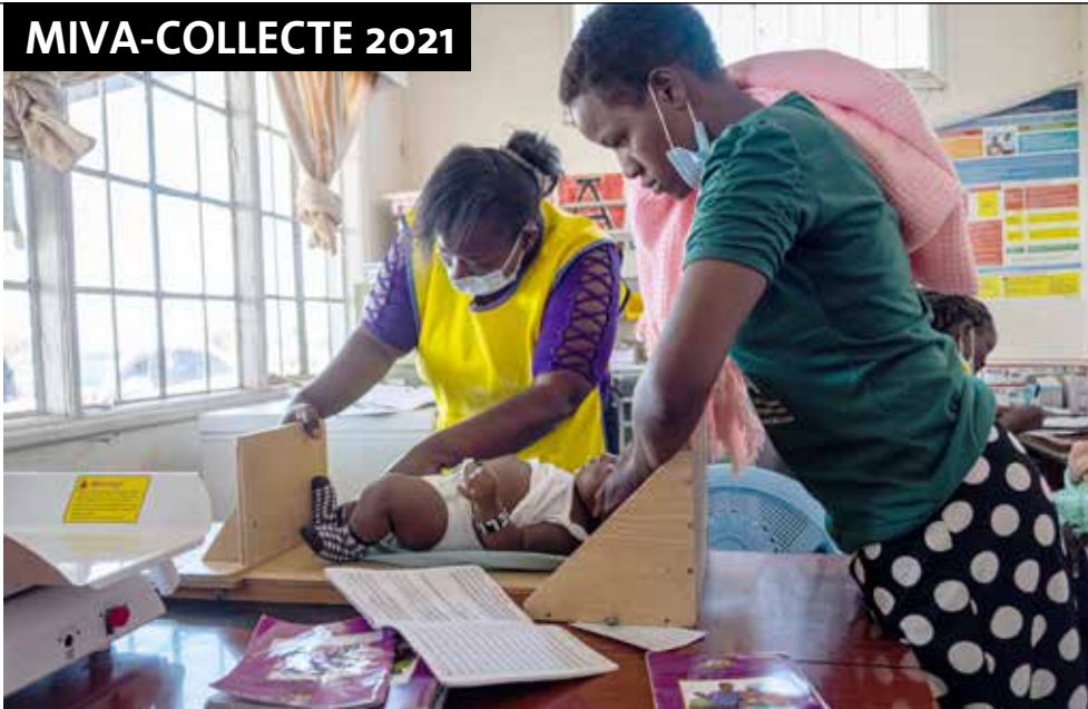
Zorg voor jonge kinderen in de kliniek in Kajiado, Kenia