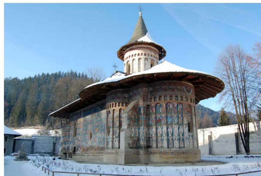
Het klooster Voronets in Roemenië