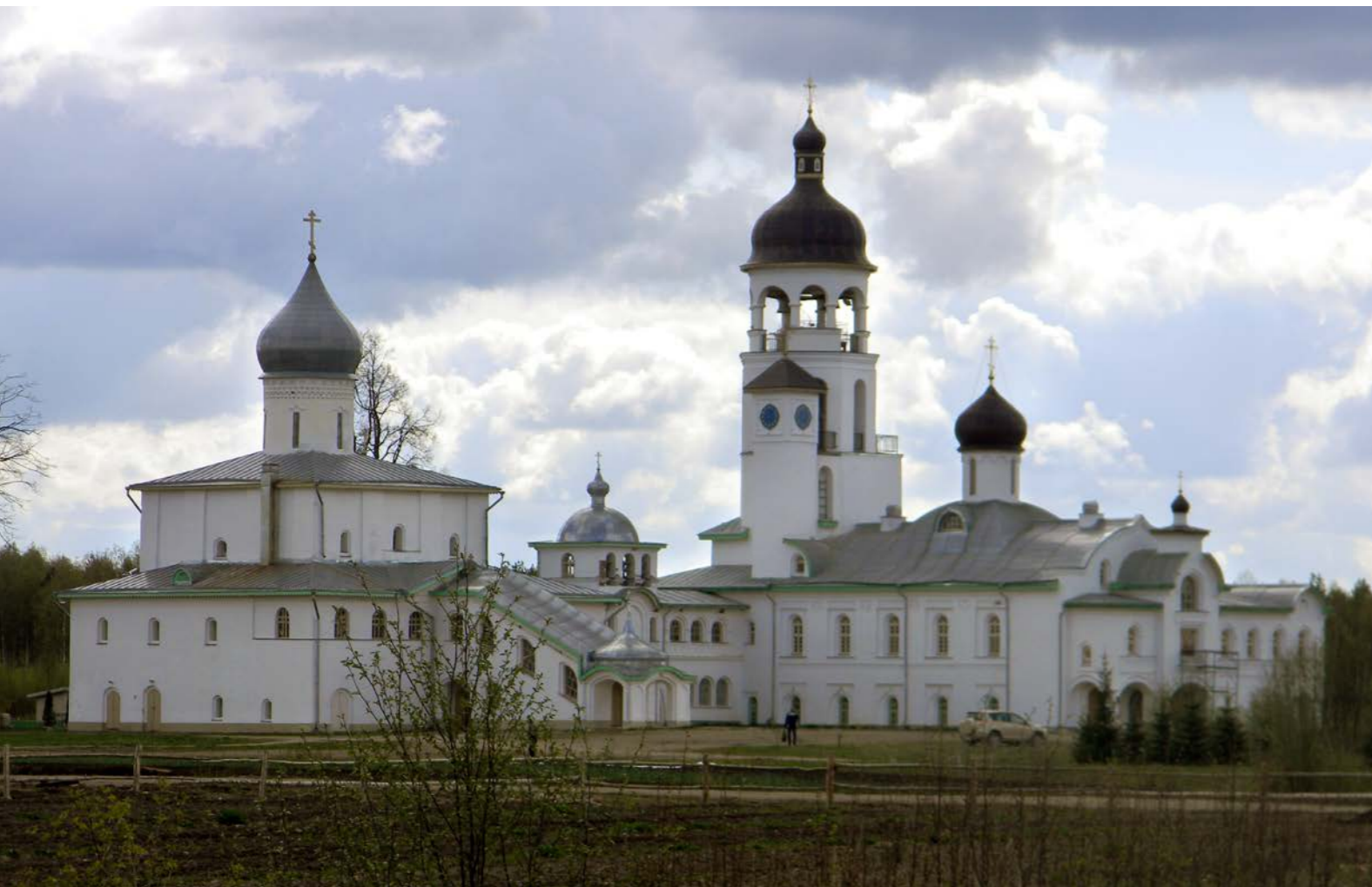
Klooster in Pskov in Noord-West Rusland

Een taak van het IVOC is een breder publiek te informeren over het Oosters Christendom. In 2018 verscheen het Handboek Oosters Christendom, een omvangrijk standaardwerk waar lang aan gewerkt is door de vorige directeur Herman Teule en Alfons Brüning en waar vele anderen hun medewerking aan verleenden. Het