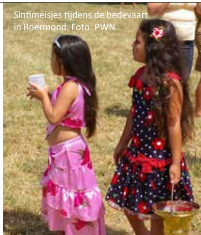
Sintmeisjes tijdens de bedevaart in Roermond.

Het Pastoraat voor Woonwagendorpers, Roma en Sinti heeft als taken: