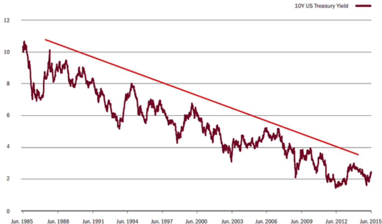
Figure 1: 10-Year US Treasury yield over the past 30 years