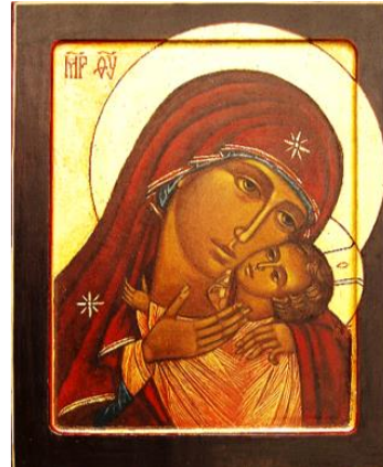
Moeder Gods van Tederheid Geschilderd door: zr.Delian de Brouwer.

De cursussen worden gegeven onder leiding van Zuster Delian de Brouwer, scmm.